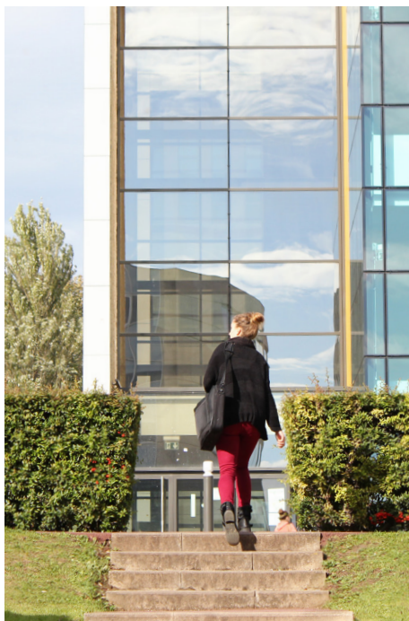
université de Caen Normandie