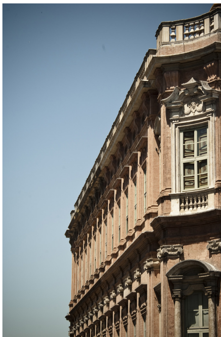
université pour étrangers de Pérouse